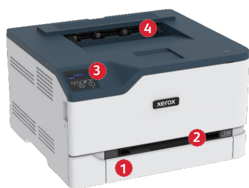
Stampante a colori Xerox® C230