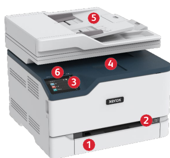
Stampante multifunzione a colori Xerox® C235